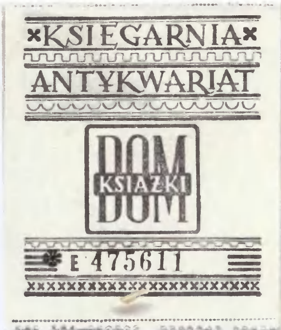
19. Wklejka antykwareczna potwierdzająca sposób nabycia druku