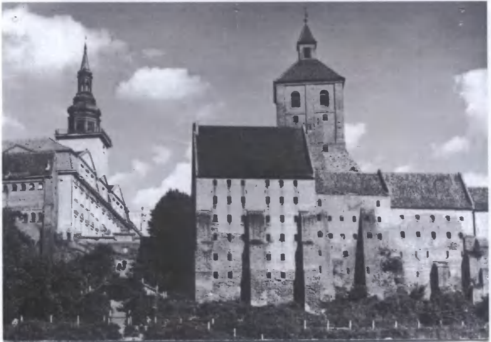
6. Grudziądz – widok od strony Wisły.