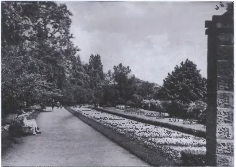
11. Grudziądz – fragment Ogrodu Botanicznego.