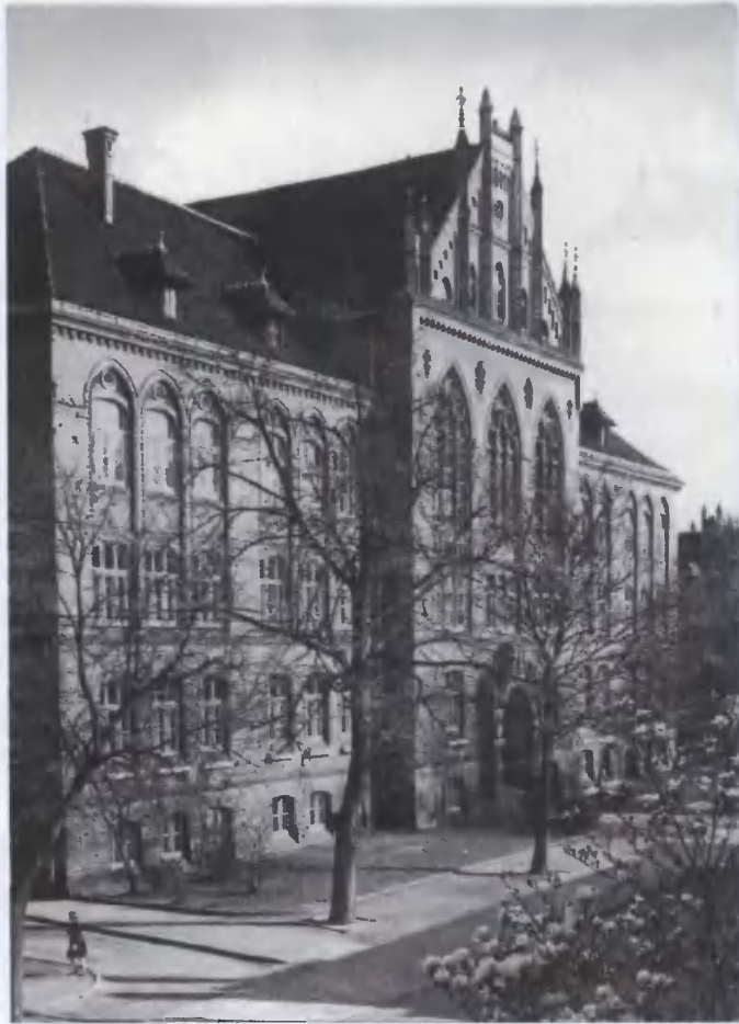
8. Grudziądz – Państwowe Liceum Pedagogiczne dla Wychowawczyń Przedszkoli.