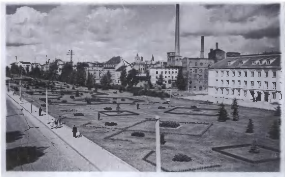
12. Grudziądz- fragment miasta.