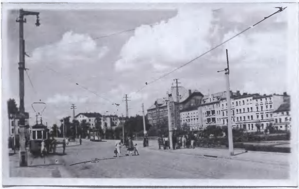
13. Grudziądz- fragment miasta.