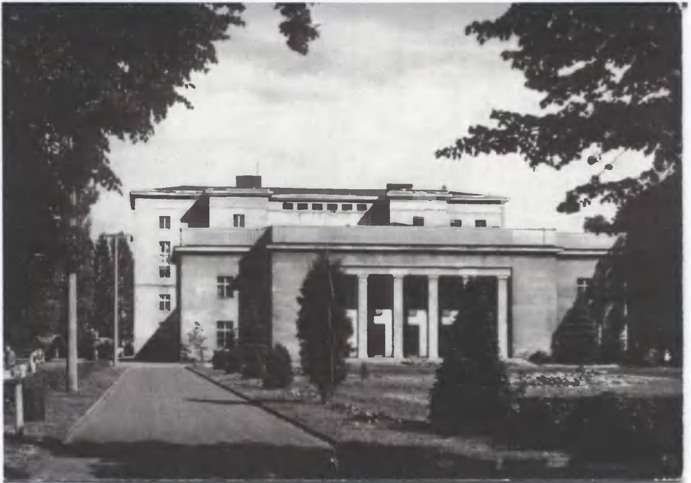
10. Grudziądz – Teatr Ziemi Pomorskiej.