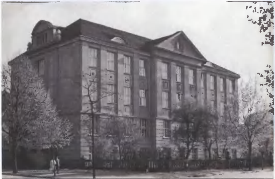
9. Grudziądz – Technikum Mechaniczne. Fotografia Adama Wolnikowskiego