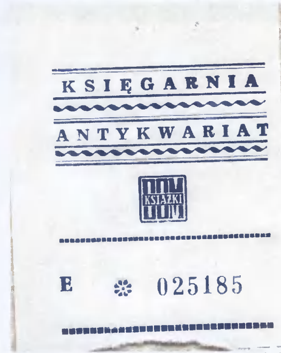
20. Wklejka antykwareczna potwierdzająca sposób nabycia druku