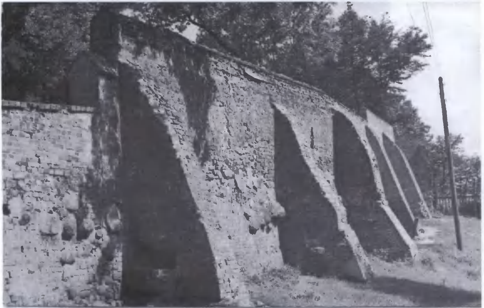
7. Grudziądz – fragment murów miejskich wzdłuż ul. Zamkowej.